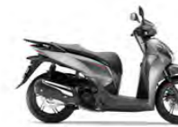
Air Force Grey