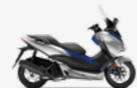
Lucent Silver Metallic Matt Pearl Pacific Blue