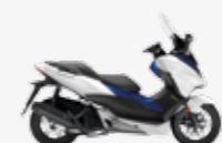
Matt Pearl Cool White Matt Pearl Pacific Blue