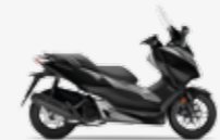
Black / Matt Ruthenium Silver Metallic