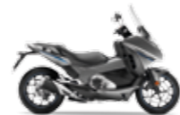
Matt Alpha Silver Metallic