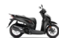
Matt Cynos Grey Metallic