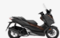
Matt Cynos Grey Metallic Matt Pearl Havana Brown