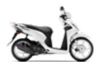
Pear Cool White