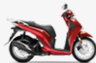
Pearl Splendour Red