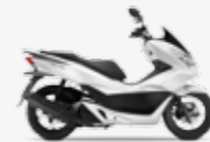
Pearl Cool White