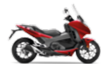
Candy Chromoshere Red