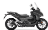
Matt Gunpowder Black Metallic