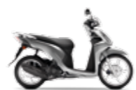
Moondust Silver Metallic