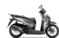
Matt Ruthenium Silver Metallic