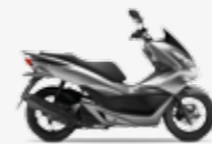
Moondust Silver Metallic