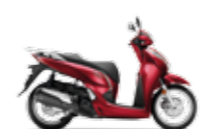
Pearl Splendour Red