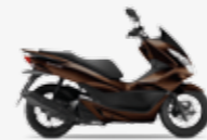
Pearl Havana Brown