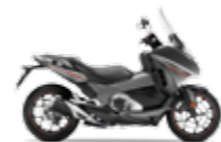
Matt Majestic Silver Metallic