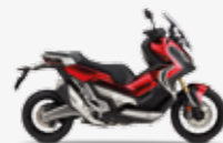
Candy Chromosphere Red