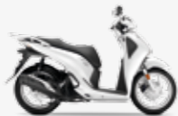
Pearl Cool White