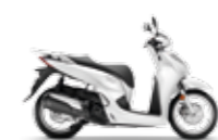
Pearl Cool White