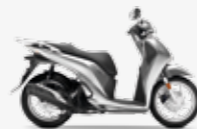
Lucent Silver Metallic