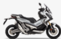
Digital Silver Metallic