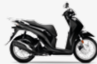
Pearl Nightstar Black