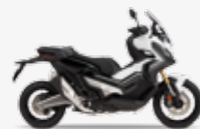
Pearl Glare White