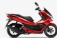
Pearl Siena Red