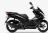
Pearl Nightstar Black