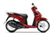
Pear Splendour Red