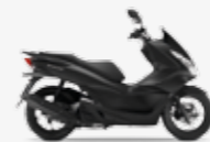
Matt Carbonium Grey Metallic